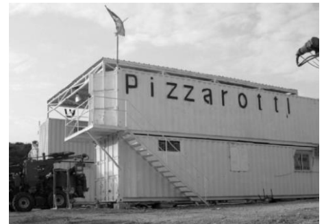
La Pizzarotti nella principale base logistica per il treno A1, ottobre 2010

Tra le aziende private, è coinvolta nel progetto la Pizzarotti S.p.A. di Parma, che si rende complice nella violazione della Legalità Internazionale e partecipa dei crimini di guerra commessi da Israele. Nonostante diverse e motivate sollecitazioni a desistere da quest'impresa, la Pizzarotti ha deciso di proseguire nei lavori.